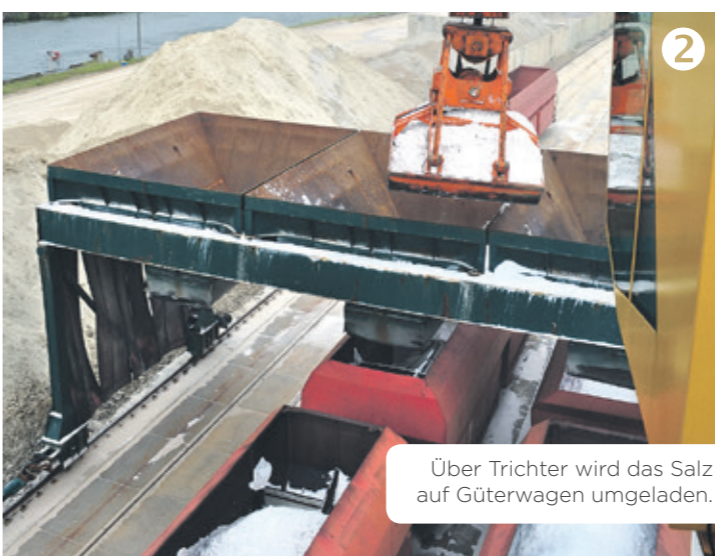
Über Trichter wird das Salz auf Güterwagen umgeladen.