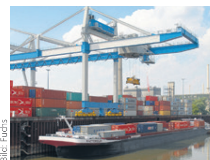
Das Containerterminal DCH im Hafen Düsseldorf zählt zu den Unterzeichnern der Hafenvereinbarung.

Der Düsseldorfer Hafen liegt im Zentrum der Landeshauptstadt. Fernsehturm, Landtag und Stadttor, Sitz der Landesregierung NRW, sind nur einen Steinwurf entfernt. Ein Teil des Hafens, der sogenannte Medienhafen, wurde seit 1989 zum Bürostandort umgewandelt. Pläne der Stadt, im Hafen Wohnungen zu bauen, lösten bei den dort ansässigen Produktions- und Logistik-Unternehmen die Sorge aus, dass es wegen der Lärmimmissionen zu Konflikten kommen könnte. Um die Interessen beider Seiten zusammenzuführen, haben die Stadt Düsseldorf und die Hafenbetriebe in diesem Jahr eine Hafenvereinbarung unterzeichnet. Sie verfolgt zum einen die Zukunftssicherung des Wirtschaftshafens und zum anderen die Umnutzung der innenstadtnahen Flächen im Anschluss an den Medienhafen sowie die Ergänzung des Bürostandortes mit Wohnanteilen in Mischgebietsstrukturen, um ein lebendiges, urbanes Stadtviertel zu entwickeln. Mit der Vereinbarung werde für die Betriebe Investitionssicherheit geschaffen und die weitere Entwicklung des Hafengebietes ermöglicht, erklärte Oberbürgermeister Thomas Geisel (SPD). (mf)