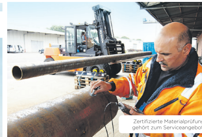
Zertifizierte Materialprüfung gehört zum Serviceangebot.