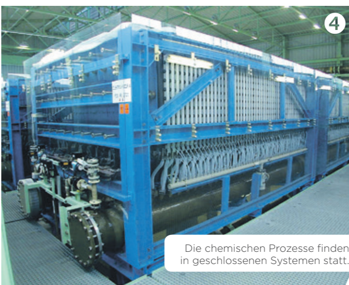
Die chemischen Prozesse finden in geschlossenen Systemen statt.