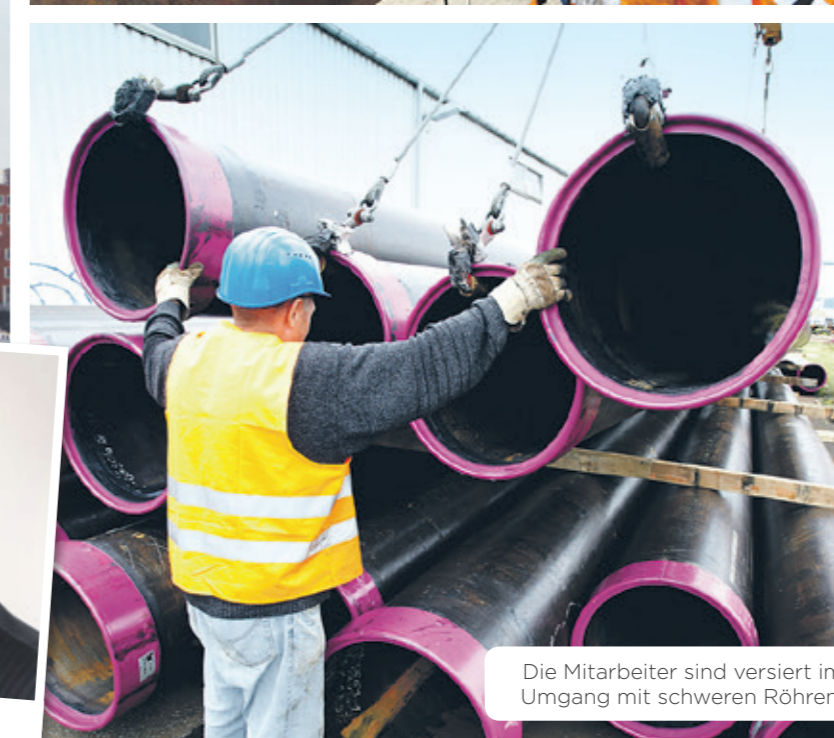
Die Mitarbeiter sind versiert im Umgang mit schweren Röhren.