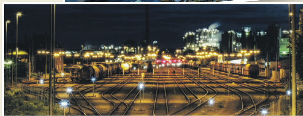
Klare Komposition: Die Gleisanlagen der HGK im Güterbahnhof Godorf bei Nacht.