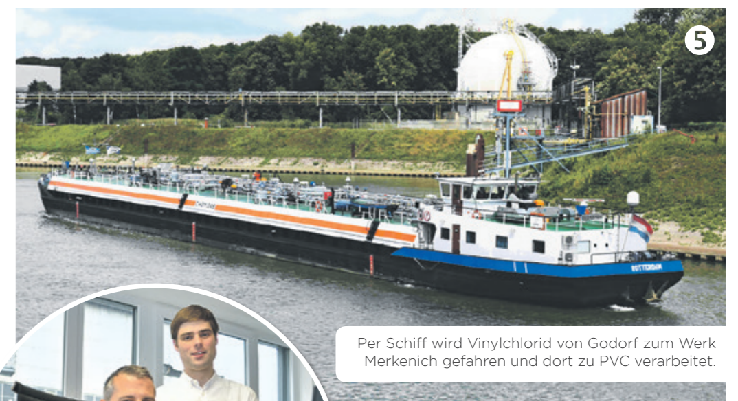
Per Schiff wird Vinylchlorid von Godorf zum Werk Merkenich gefahren und dort zu PVC verarbeitet.