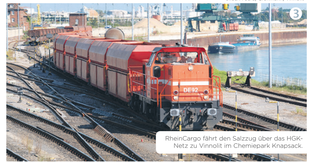
RheinCargo fährt den Salzzug über das HGK-Netz zu Vinnolit im Chemiepark Knapsack.