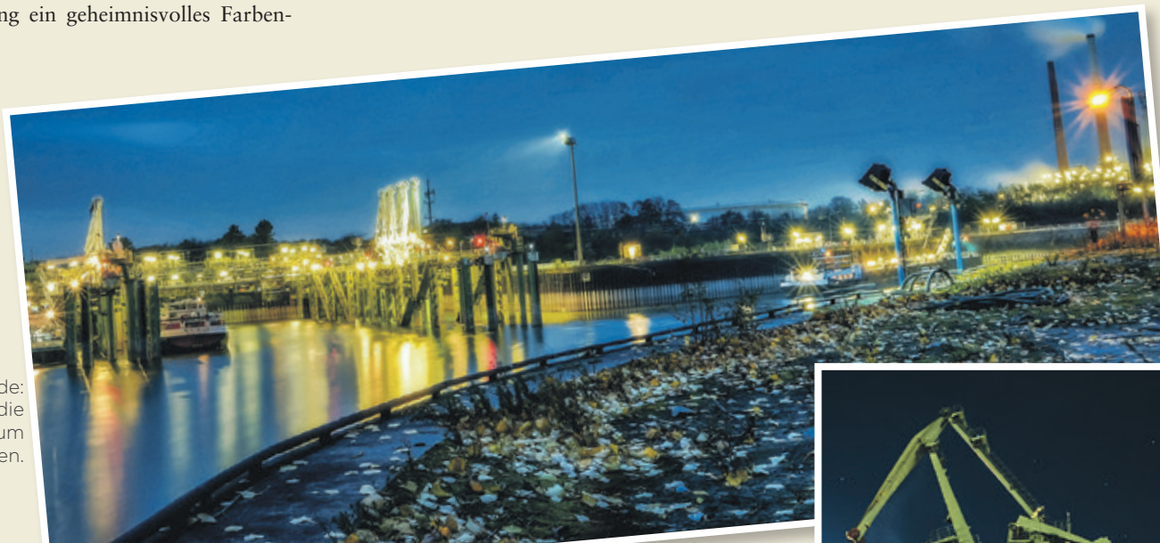
Blaue Stunde: Blick auf die Einfahrt zum Godorfer Hafen.

„Als Fotograf reizt es mich, die besondere Ästhetik herauszuarbeiten, die Industrieanlagen bei Einbruch der Dunkelheit entwickeln“, betont Bochem. Das Ergebnis kann sich sehen lassen!