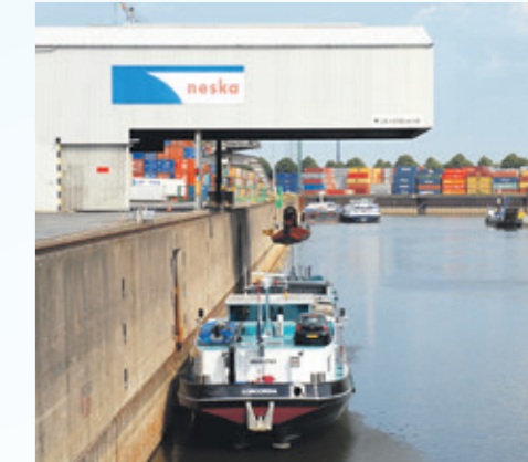
Am Rhein verfügt die neska-Gruppe über ein dichtes Netzwerk eigener Terminals.

Zentrum ihres bundesweiten Netzwerks ist das Rheinland. Hier unterhalten Unternehmen der neska-Gruppe wie RRT, dbt, KCT, DCH, uct, CTS und Pohl eigene Terminals in Duisburg, Krefeld, Düsseldorf, Neuss, Dormagen und Köln. Weitere Standorte in Hamburg, Berlin, Dresden und Mannheim sowie Dordrecht bei Rotterdam sorgen für kurze Wege zu den Kunden und eine enge Anbindung an die Seehäfen. Die neska-Gruppe ist eine Tochtergesellschaft der Häfen und Güterverkehr Köln AG. www.neska.com