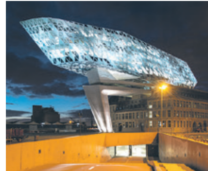
Grandiose Architektur: die neue Hafenzentrale von Antwerpen bei Nacht.

Port House von Zaha Hadid Neues Wahrzeichen im Hafen Antwerpen