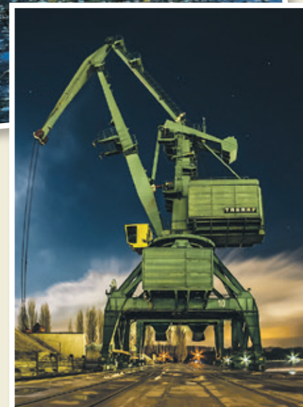
Grüner Gigant: Der Hafenkran ähnelt einem riesigen Insekt.