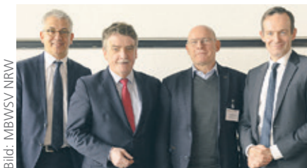
Von links: Die Landesverkehrsminister Tarek Al-Wazir (Hessen), Michael Groschek (NRW), Winfried Hermann (Baden-Württemberg) und Volker Wissing (Rheinland-Pfalz).

Bei der dritten Konferenz der Rhein-Anlieger haben Politiker und Experten am 14. November in Düsseldorf über die Zukunft des Rheinkorridors für die Transport- und Logistikketten diskutiert. Die Leistungsfähigkeit des Rheins als Verkehrsweg, der Lärmschutz im Rheintal oder der Ausbau der Verknüpfungspunkte zwischen den Verkehrsträgern – an vielen Stellen sehen Experten Verbesserungsmöglichkeiten. Die Verkehrsminister der Rhein-Anliegerländer, Michael Groschek (NRW), Tarek Al-Wazir (Hessen), Volker Wissing (Rheinland-Pfalz) und Winfried Hermann (Baden-Württemberg), forderten mehr Tempo beim Ausbau des Rheins als Europas bedeutendste Verkehrs- und Wirtschaftsaachse. Die Infrastrukturprojekte des aktuellen Bundesverkehrswegeplans müssten zügig umgesetzt werden. An die EU-Kommission appellierten sie, die Rahmenbedingungen für öffentliche Fördergelder zur Weiterentwicklung der Binnenhäfen zu erleichtern.